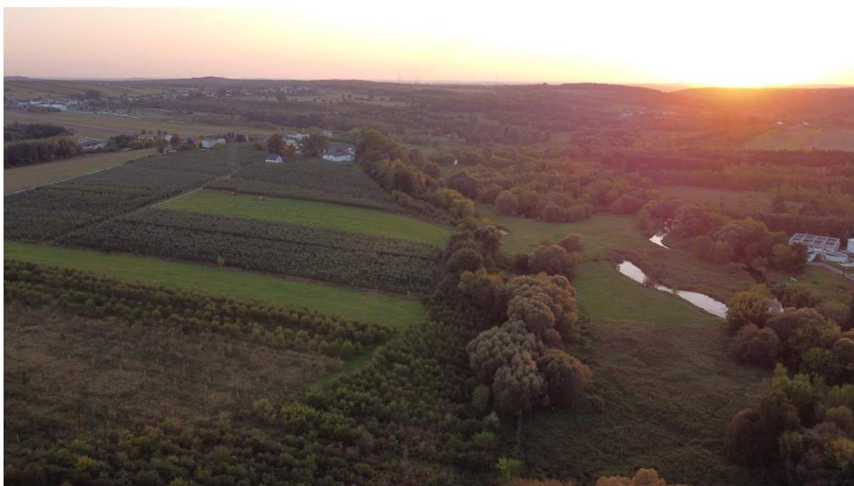
ZDJĘCIE NR 5

Dolina Warty na północ od miejscowości Siedlec (po lewej) - dobrze wyodrębniona poprzez ciąg zadrzewień łęgowych dolina Warty; w pobliżu geometryczne układy nasadzeń drzew, niewielkich sadów. Widoczne też efekty naturalnej sukcesji (fot. Jakub Botwina)