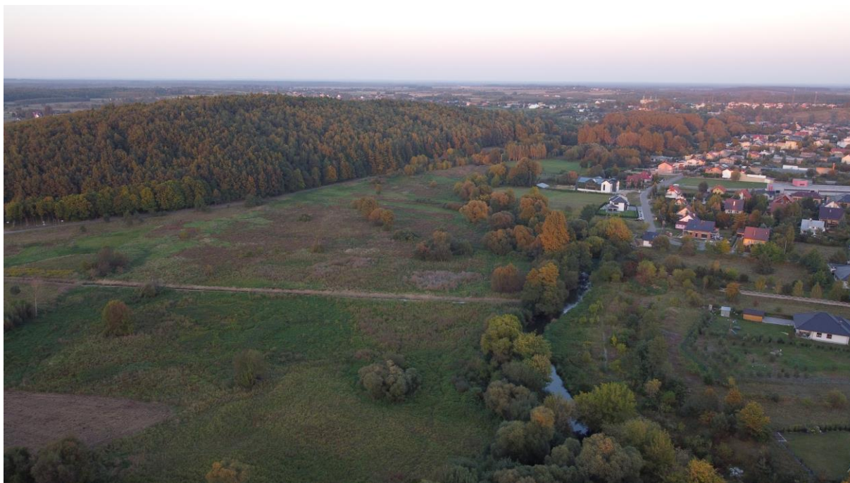
Zachowane zbiorowiska łąkowe nad Wartą. Po prawej na zdjęciu wkraczająca na terasę zalewową Warty zabudowa jednorodzinna Mstowa, z lewej Góra Dobra.