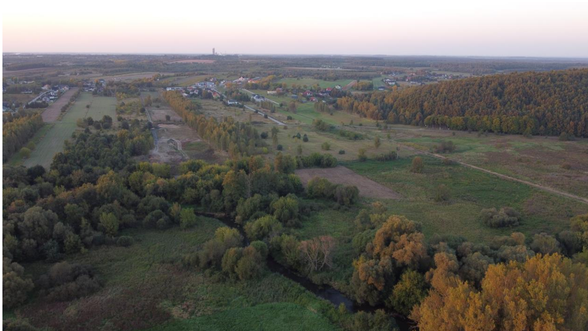
Procesy naturalnej sukcesji na co raz rzadziej użytkowane łąki nad Wartą. Widok w kierunku zachodnim od Mstowa.