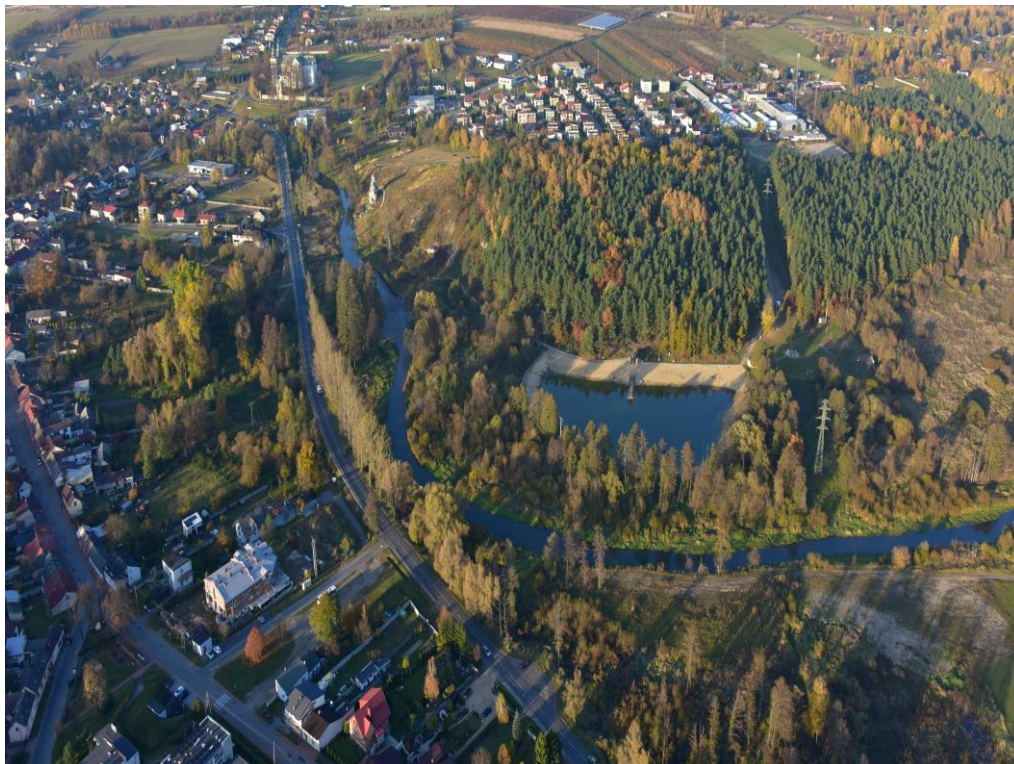
Przełom Warty w Mstowie. Widoczny teren rekreacyjno-sportowy, iglica ostańca skalnego zwanego Skałą Miłości, po lewej zabudowa starego Mstowa, na dalszym planie nowa zabudowa jednorodzinna. W tle daleka dominanta klasztoru Wancerzowie